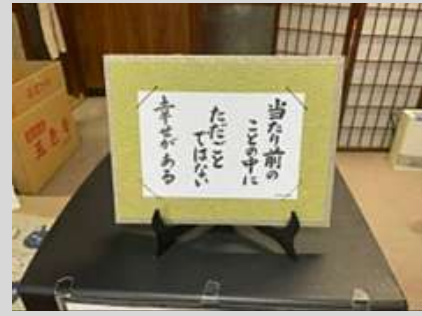
玄関のお線香着火台の横に飾った例 (東京1組 光桂寺)